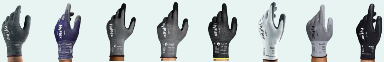
HyFlex® 11-531 HyFlex® 11-561 HyFlex® 11-571 HyFlex® 11-581 HyFlex® 11-543 HyFlex® 11-724 HyFlex® 11-754 HyFlex® 11-757

이 문서나 Ansell의 다른 어떠한 기술도 상업적 적합성 보증이나 Ansell 제품이 특정 용도에 적합하다는 보증으로 해석되지 않아야 합니다. 어떤 장갑도 등급에 관계없이, 절단에 대한 완전한 보호를 제공하지 않습니다.